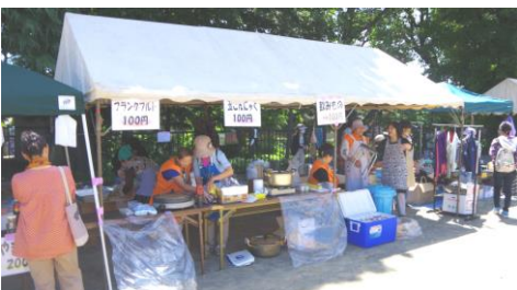
主婦の会はバザーや軽食販売