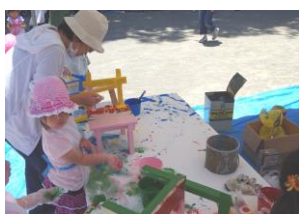
塗装してオリジナル