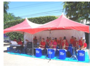
本格的な演奏に釘づけ