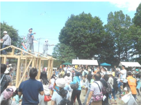
上棟式・餅まきに沸く会場