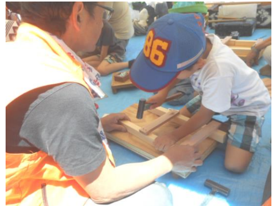
人気コーナーの大工体験 椅子作り

6月4日(日)、小平盛り上げでも市民広場にて第40回住宅デーが盛大に開催されました。この日は一年に一度、建設職人が地元の方々にアピールする日です。支部の間が集まって、会場はお祭りのような雰囲気。恒例となったジャズバンドの演奏と小学生によるよさこい踊りは、どちらも迫力あるステージで住宅デーを盛り上げています。一日楽しめるイベントです。