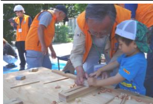
鉋(かんな)で箸作り