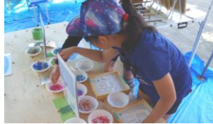
漆喰手形に飾り付け