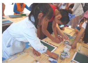
ミニ黒板にタイルを