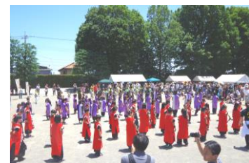
迫力の踊りで来場者を魅了