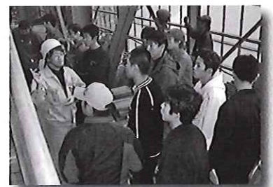
文化財改修工事現場の見学