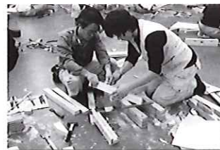
ベテラン指導員による実技指導