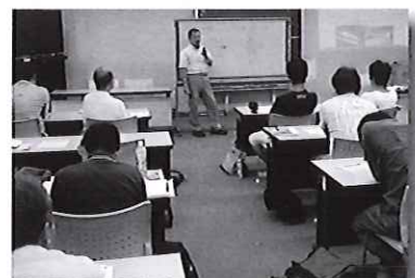
学科の授業も充実