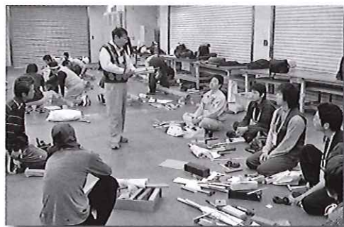
まずは道具の使い方と手入れから