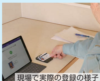
現場で実際の登録の様子